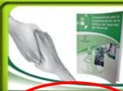
Centro de Seguridad del Paciente