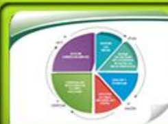
Caja de Herramientas