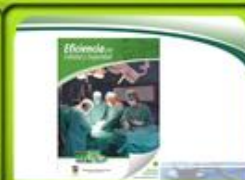
Experiencias e Investigación