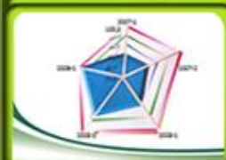
Cuadro de Mando del SOGC