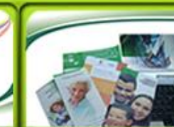
Información a Usuarios