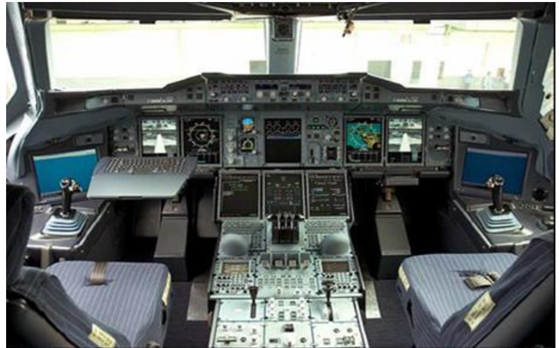
Cabine de avião